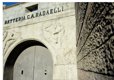
Batteria Radaelli - F6