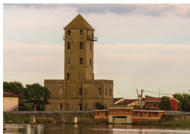
Torre - T2