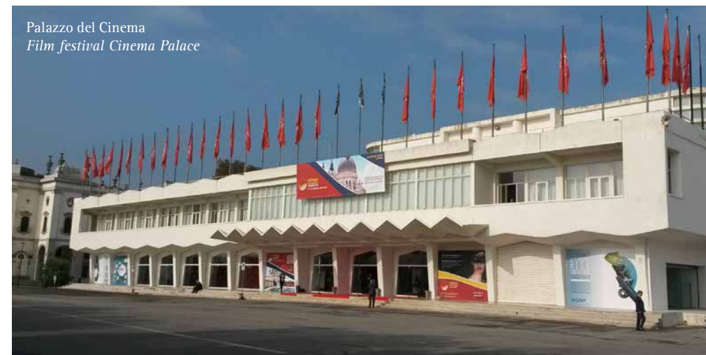
Palazzo del Cinema Film festival Cinema Palace