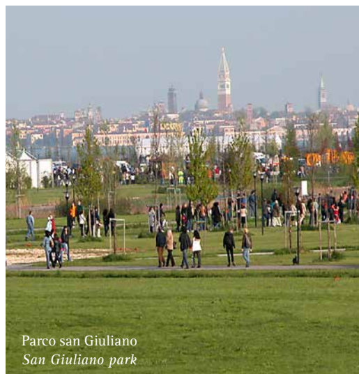
Parco san Giuliano San Giuliano park