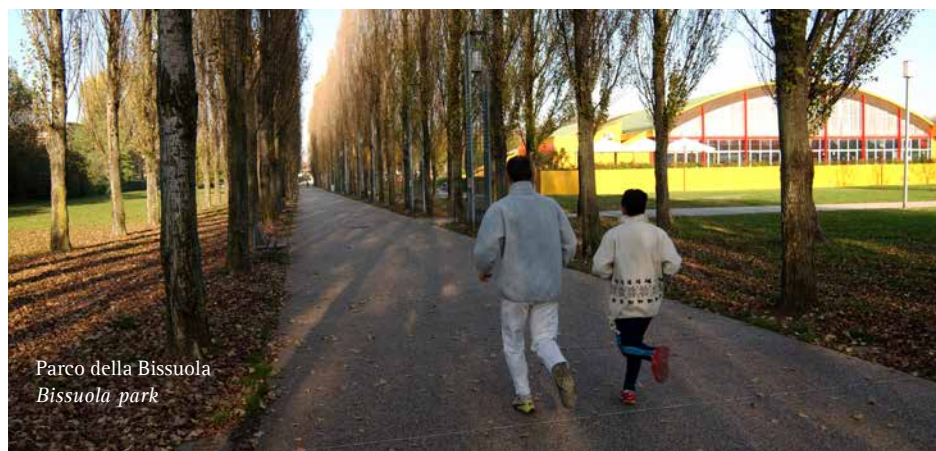
Parco della Bissuola Bissuola park