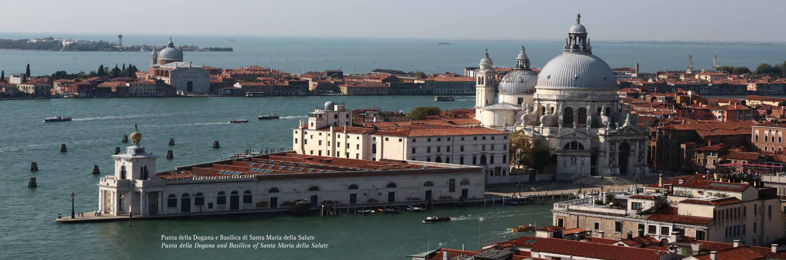
Punta della Dogana e Basilica di Santa Maria della Salute Punta della Dogana and Basilica of Santa Maria della Salute