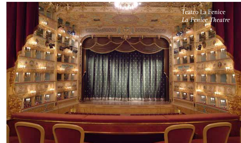
Teatro La Fenice La Fenice Theatre