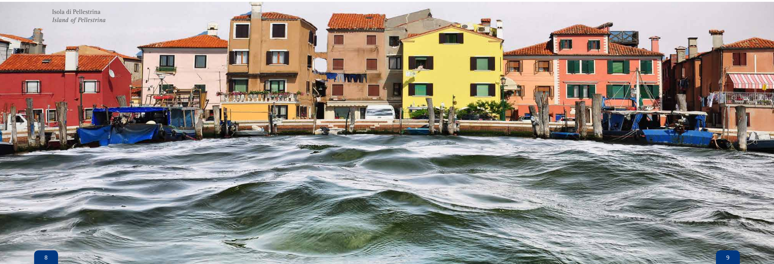
Isola di Pellestrina Island of Pellestrina

LA LAGUNA SUD. La laguna a sud di Venezia si caratterizza per gli spazi ampi e aperti. Qui il paesaggio lagunare si presenta come un vasto specchio d'acqua dal quale emergono lunghe file di bricole intervallate da isole. Tra gli isolotti si distinguono ottagoni, batterie e polveriere: avamposti militari che si aggiungono alle isole più grandi come San Lazzaro degli Armeni, San Servolo, San Clemente, Sacca Sessola, Lazzaretto vecchio, Santa Maria della Grazie, Poveglia. Grazie ai mezzi pubblici (vaporetti e autobus) è possibile attraversare le isole di Lido e Pellestrina e visitare i pittoreschi borghi di Malamocco, San Pietro in Volta, Pellestrina, Portosecco e Chioggia. A rinforzo del versante orientale dell'isola del Lido, stanno i Murazzi, poderosi muri d'argine in pietra d'Istria, una delle più imponenti difese a mare erette nel Settecento dalla Serenissima per fronteggiare le mareggiate. Vale la pena raggiungere la riserva naturale di Ca' Roman, all'estremità meridionale dell'isola di Pellestrina. Qui si trova una spiaggia selvaggia, circondata dalle dune che la separano da un fitto bosco in cui vivono molte specie protette di uccelli, tra cui il fratino. Ai margini occidentali della laguna Sud si trovano le valli da pesca e le "casse di colmata" - aree di bonifica dove era previsto l'insediamento della terza zona industriale e dove oggi si sperimentano forme di rinaturalizzazione.