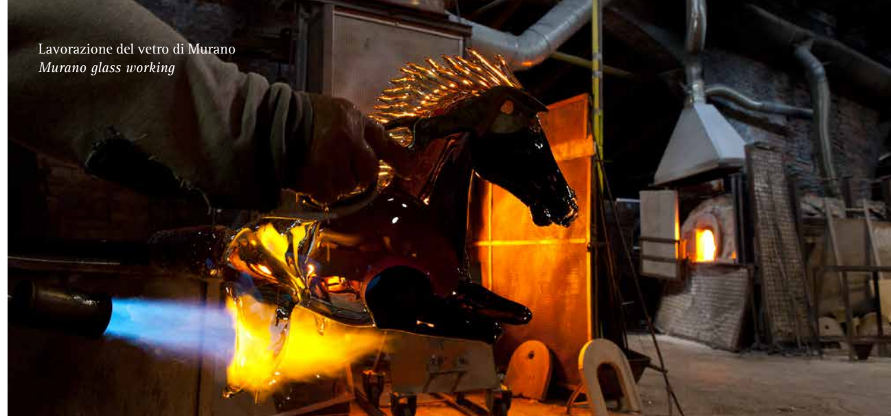
Lavorazione del vetro di Murano Murano glass working

tender lagoon crabs. The most famous meat dish is undoubtedly "figà àea venessiana", that is Venetian style liver, which is either veal or pork liver cooked with onions, usually accompanied by white polenta. Among the vegetable side dishes is castraure impanae, that is the first small Sant'Erasmus violet artichokes, breaded and fried, and beans with onion. As to desserts, try the baicoli, ideal biscuits to have with coffee or zabaione, essi biscuits (name given by their 'S' shape) or the bussolài (donut-shaped) that are typical of Burano. During Carnival, the classic fritole prepared from a batter with sultanas and pine nuts, are not to be missed.