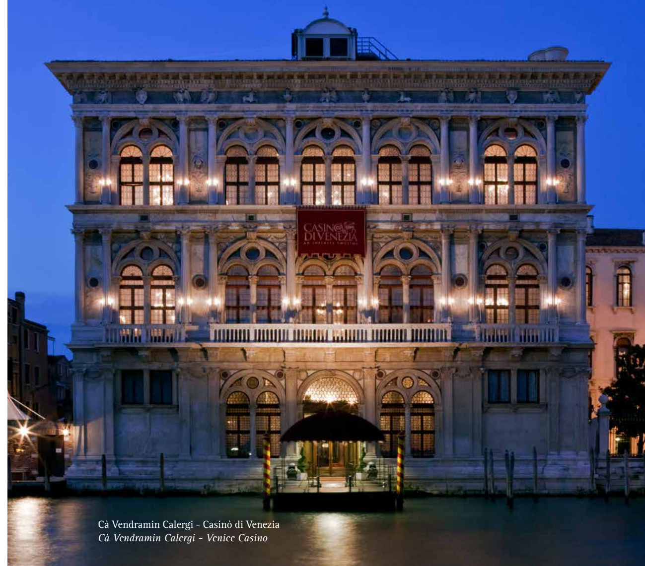
Ca' Vendramin Calergi - Casinò di Venezia Ca' Vendramin Calergi - Venice Casino

Important monumental sites open to the public today host other important cultural institutions such as the Archivio di Stato, the Ateneo Veneto, the Istituto Veneto of Sciences, Letters and Arts, the Palazzetto Bru Zane, the Ca' Foscari University and the Casino of Venice with its historic headquarters of Ca' Vendramin Calergi.