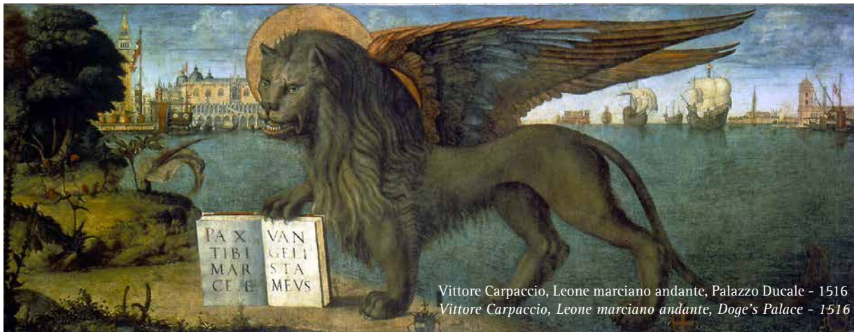
Vittore Carpaccio, Leone marciano andante, Palazzo Ducale - 1516 Vittore Carpaccio, Leone marciano andante, Doge's Palace - 1516