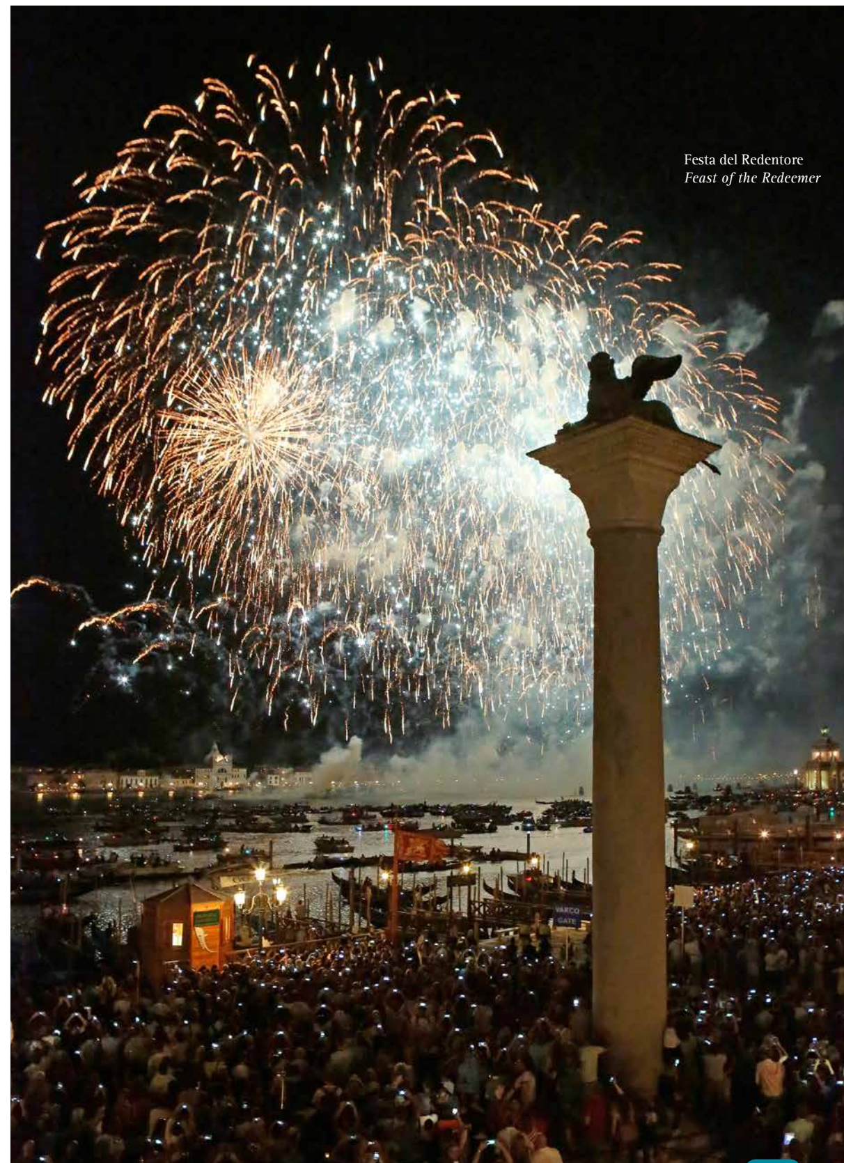
Festa del Redentore Feast of the Redeemer

Dicembre: eventi natalizi e celebrazione del Capodanno in Piazza San Marco con spettacolo pirotecnico