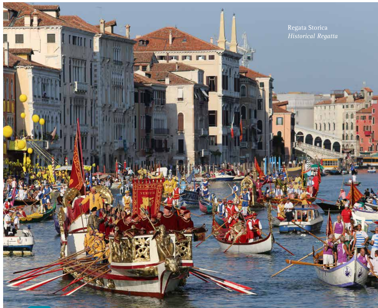
Regata Storica Historical Regatta

December: Christmas events and New Year's celebrations in St. Mark's Square with a firework display