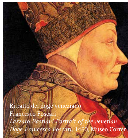
Ritratto del doge veneziano Francesco Foscari Lazzaro Bastiani Portrait of the venetian Doge Francesco Foscari, 1460, Museo Correr

Importanti sedi monumentali aperte al pubblico ospitano oggi altre istituzioni culturali di rilievo quali l'Archivio di Stato, l'Ateneo Veneto, l'Istituto Veneto di Scienze Lettere ed Arti, il Palazzetto Bru Zane, l'Università Ca' Foscari e il Casinò di Venezia con la sua sede storica di Ca' Vendramin Calergi.